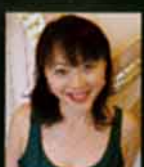
Tomoko Maruyama 神谷朝子 (ハープ)

入場料＝SS席・9,000円(1階前5列) S席・8,000円 A席・6,000円 B席・4,000円 学生席・3,000円(4階席) シルバーヘアS席(お二人のうち、お一人以上が60歳以上の方)2枚で15,000円 ※当日全席500円UP ※シルバーヘアS席は前売りのみ