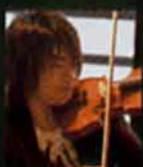
Mitsuo Ikeyama 室屋光一郎 (ヴァイオリン)